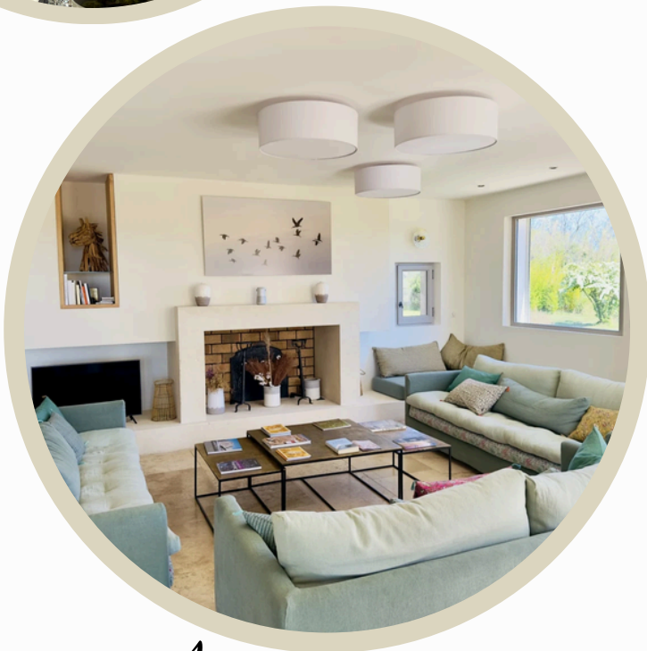
La "salle" de formation